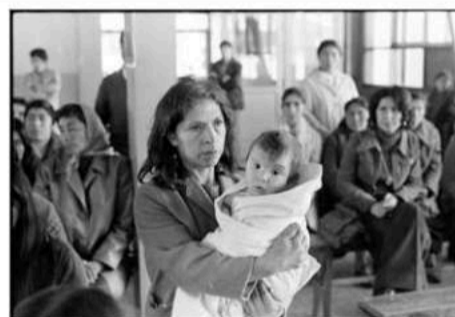
El proyecto busca descubrir quiénes fueron los fotógrafos que capturaron estas imágenes.