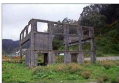
Ruinas de la siderúrgica después del terremoto más grande de la historia.

el plan de restauración continúa ahora en la etapa de rescate de sus valiosos ocho vitrales. Cinco de ellos dan a la calle, de manera que el proyecto también contempla idear un sistema de protección. "Queremos poner reja de seguridad especial para cuidarla del movimiento público en el exterior, cuya forma esté inspirada en el estilo de la casona, sin hacer imitaciones, sino dejando el testimonio de que se trata de una intervención actual", anticipa la arquitecta. "Los otros tres vitrales dan hacia el patio interior de la casa. El conjunto fue elaborado con la técnica grisalla, que es compleja, porque tiene con pintura el vidrio y se consolida a alta temperatura. Los vitrales presentan muchas deformaciones y desprendimiento del plomo que une cada pieza", agrega. La casa se convertirá en el Centro Cultural Yungay Histórico.