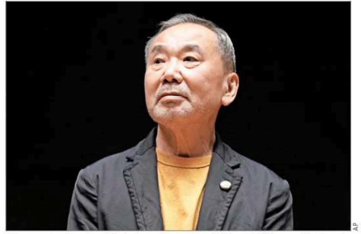
"Una espina", así calificó el cuento que escribió en 1980 y que finalmente convirtió en su nueva novela. Nunca lo dejó conforme.