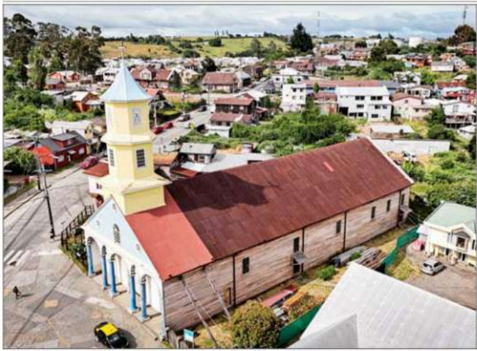
La iglesia de Chonchi tiene 45 m de largo y 18 m de ancho. La torre se eleva hasta los 23 m y su fachada tiene seis columnas unidas por arcos.